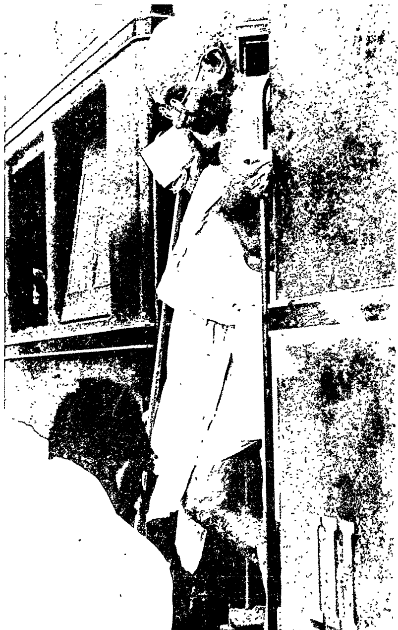
सीमा-भ्रान्त जाते हुए लाहौर रेल्वे स्टेशन पर